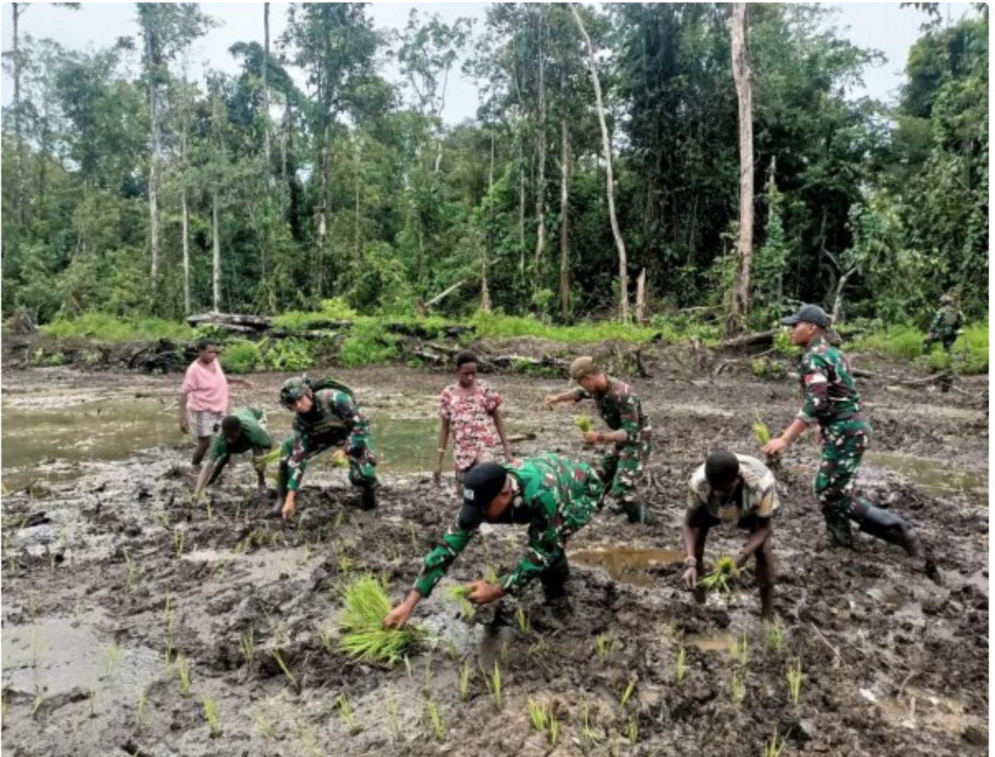
Foto: Satgas Pamtas Mobile RI-PNG Yonif 503/Mayangkara menggagas program ketahanan pangan yang melibatkan langsung warga Kampung Mumugu, Distrik Krepkuri, Kabupaten Nduga, Selasa (07/01/2025).

NDUGA- Dalam upaya membangun kesejahteraan masyarakat di wilayah