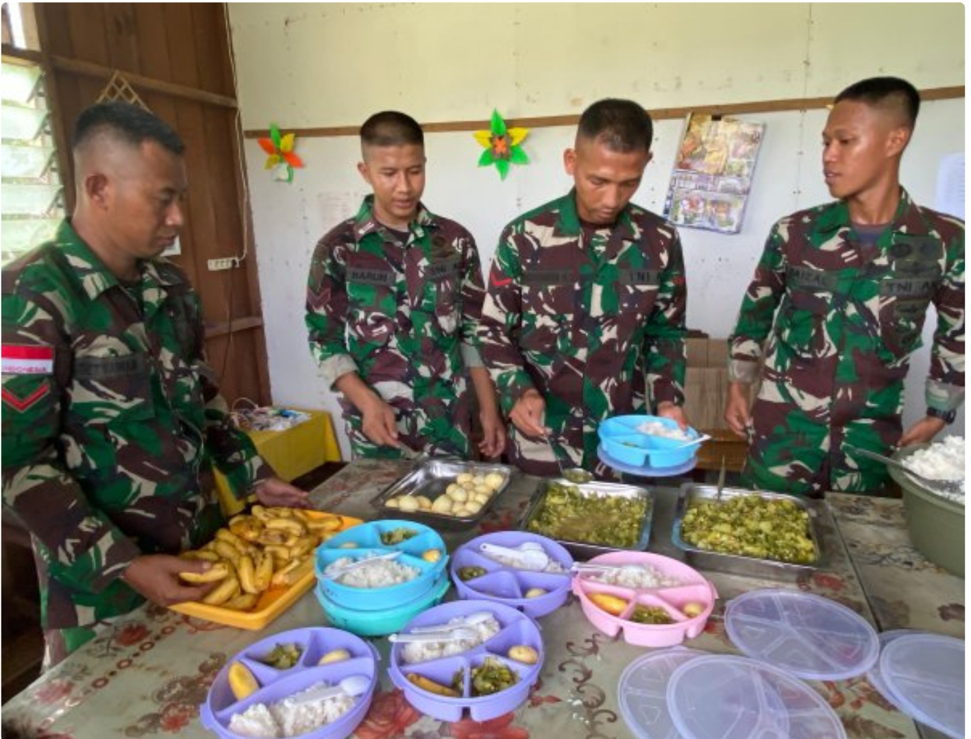
Foto: Dedikasi Satgas Pamtas Mobile RI-PNG Yonif 503/Mayangkara dalam mendukung program makan bergizi gratis pemerintah mendapat apresiasi tinggi dari masyarakat Distrik Krepkuri, Kabupaten Nduga, Papua, di sekolah rimba, Rabu (29/01/2025).