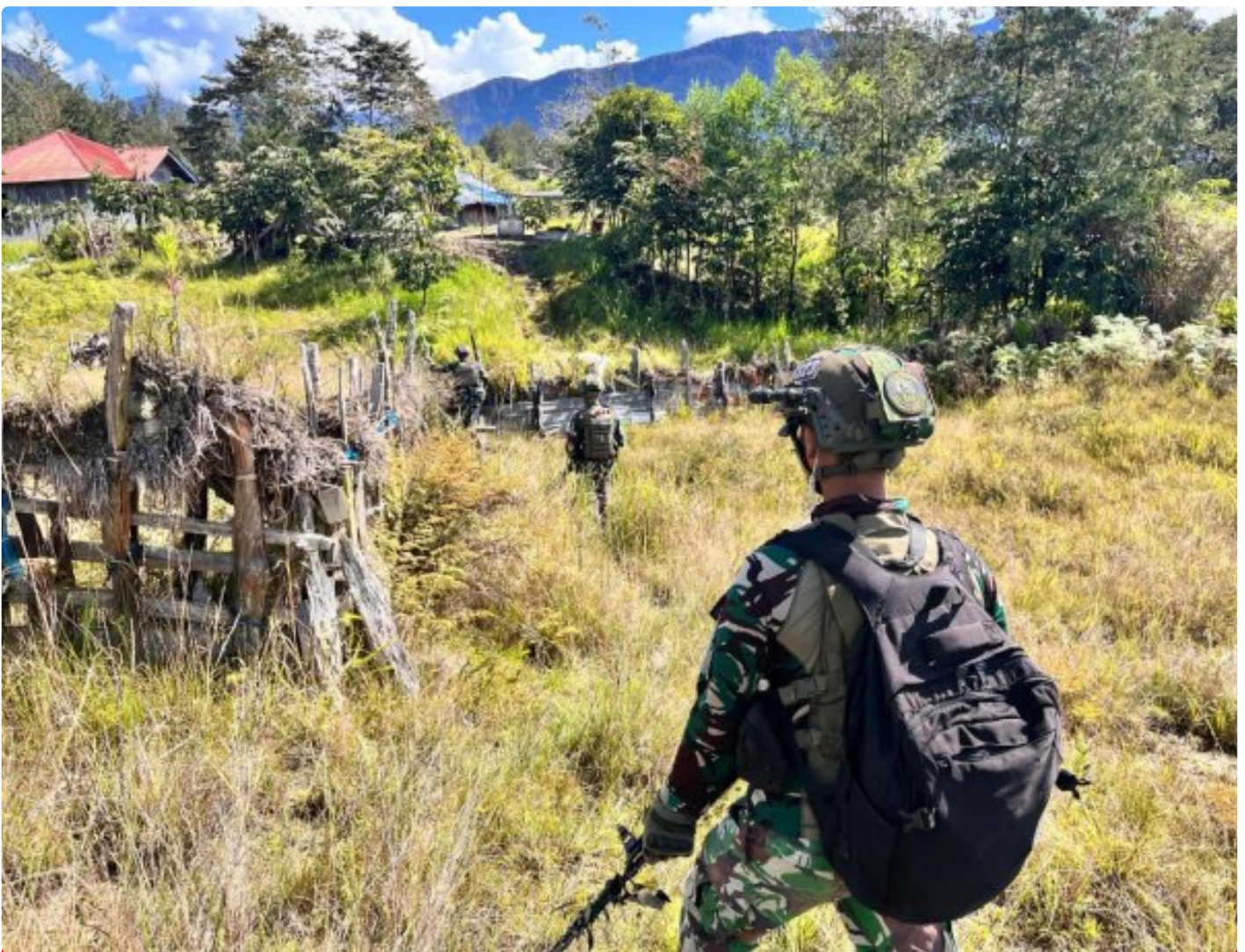
Satgas Mobile Yonif 323 Buaya Putih melaksanakan Patroli Komsos

Satgas Yonif 323 Buaya Putih Kostrad pada saat melaksanakan patroli menjaga keamanan di sektor wilayah tanggungjawabnya di wilayah kampung Gigobak, Distrik Sinak, Kabupaten Puncak, Papua terjadi kontak tembak dan pengejaran terhadap kelompok OPM, Rabu (04/12/24)