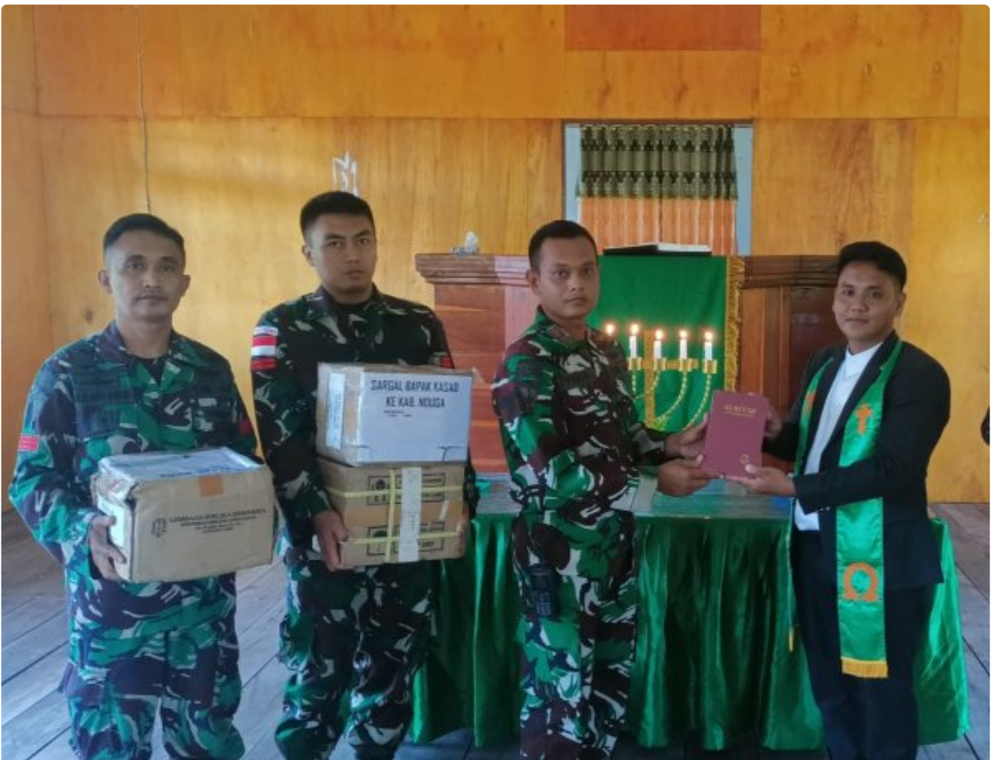
Foto: Satgas Yonif 503/Mayangkara kembali menunjukkan dedikasinya kepada masyarakat di Papua dengan memberikan dukungan alat musik untuk kegiatan ibadah di Gereja GKI Bethesda Batas Batu, Distrik Krekuri, Kabupaten Nduga. Pada Minggu, 12 Januari 2025.